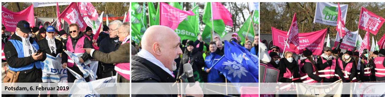
Potsdam, 6. Februar 2019

Nachdem der enttäuschende Verlauf der Verhandlungen analysiert worden war, hat die Verhandlungskommission des dbb beschlossen, den Druck auf der Straße zu erhöhen und die Warnstreiks zu inten